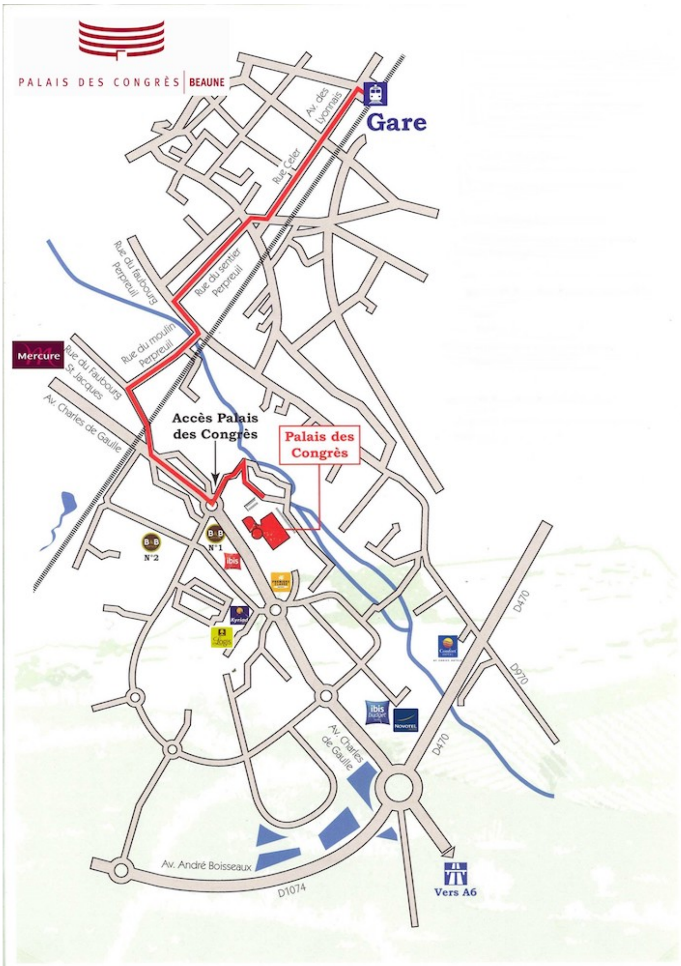
Le Palais des Congrès dispose d'un parking de 800 places en extérieur clos et gratuit